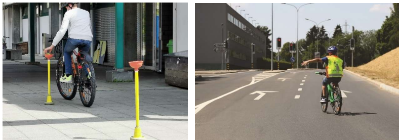
Üben im Geschicklichkeits-Parcours für mehr Velo-Sicherheit im Strassenverkehr.

Kindern nehmen aktiv am Strassenverkehr teil – beispielsweise mit dem Velo. Leider verletzen sich dabei laut BFU jährlich rund 50 von ihnen schwer. Deshalb setzt sich der TCS Bern dafür ein, solche Unfälle zu vermeiden.