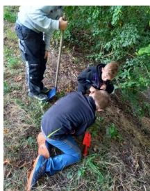
Ausflug «Boden» 3./4. Klasse