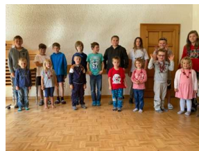
Begrüßung der neuen Kindergartenkinder