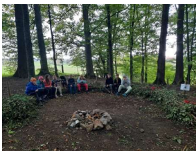
Erneuerung des Waldsofas