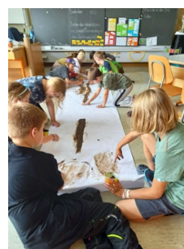
Mit Erde malen