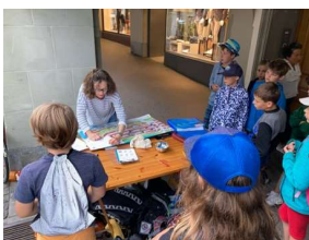
Postenlauf Stadt Bern